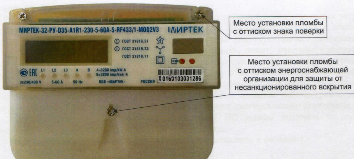
Рисунок 7 - Общий вид счетчика в корпусе типа D35