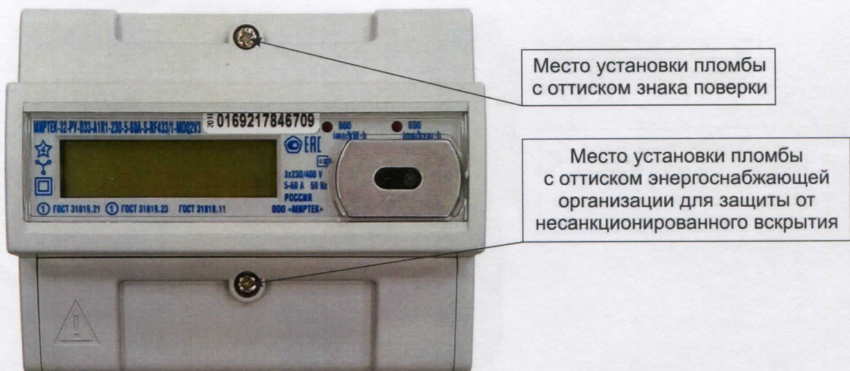
Рисунок 5 - Общий вид счетчика в корпусе типа D33