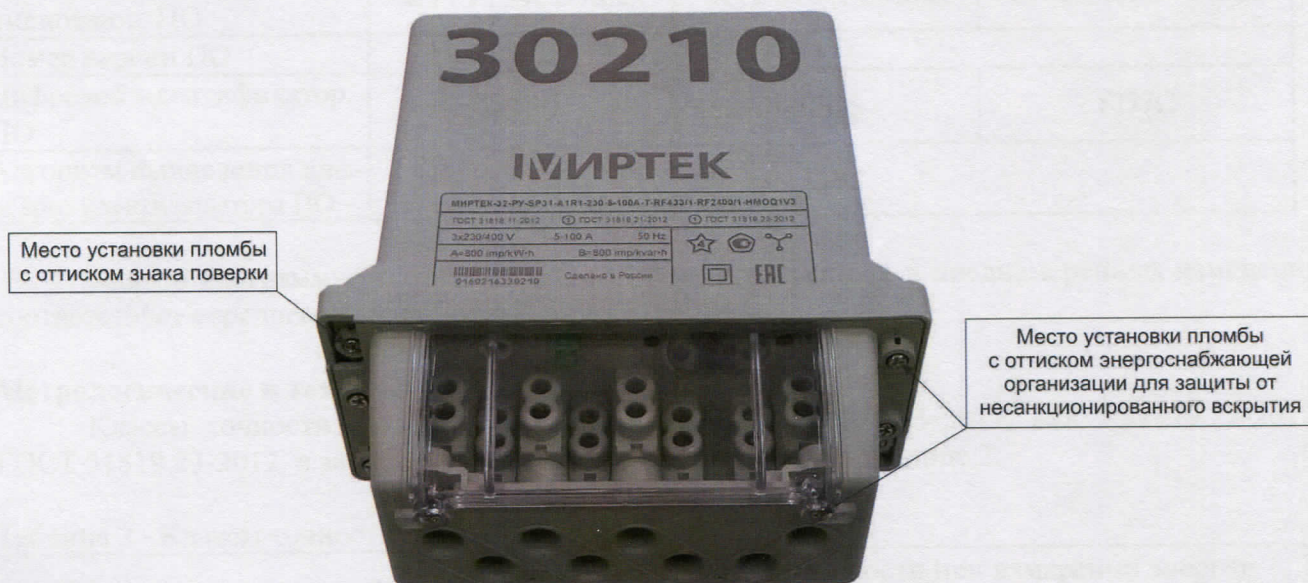
Рисунок 8 - Общий вид счетчика в корпусе типа SP31