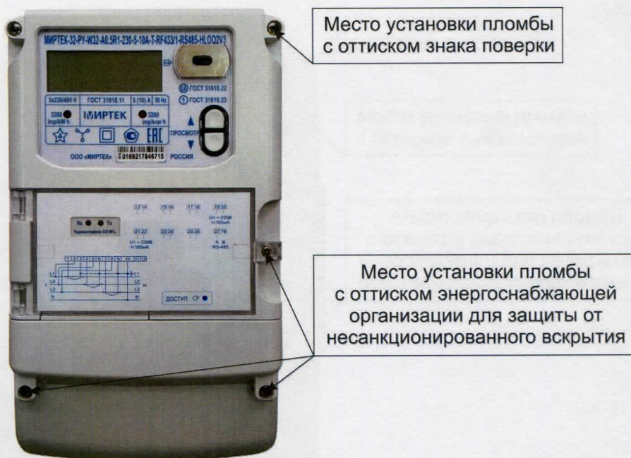
Рисунок 2 - Общий вид счетчика в корпусе типа W32