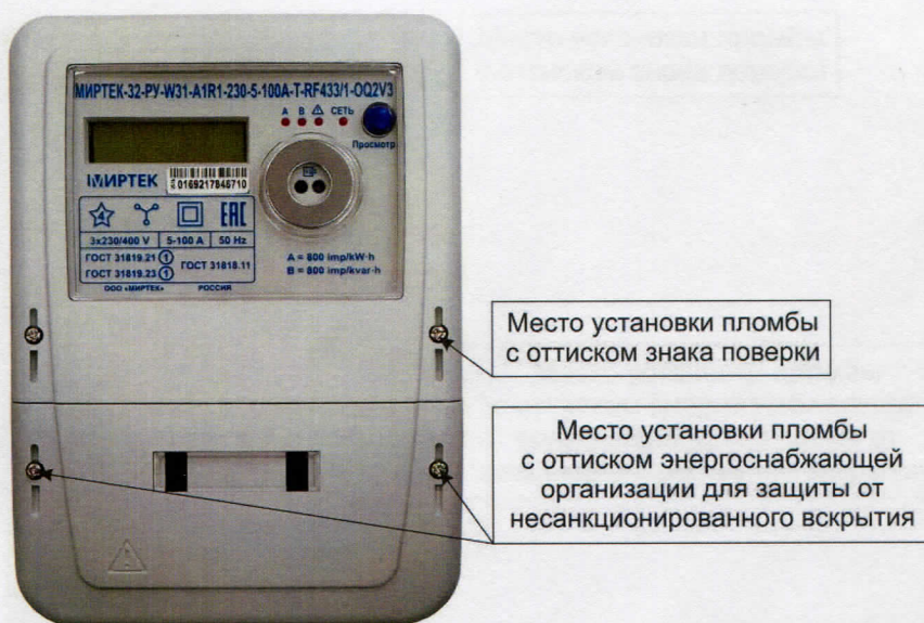
Рисунок 1 - Общий вид счетчика в корпусе типа W31