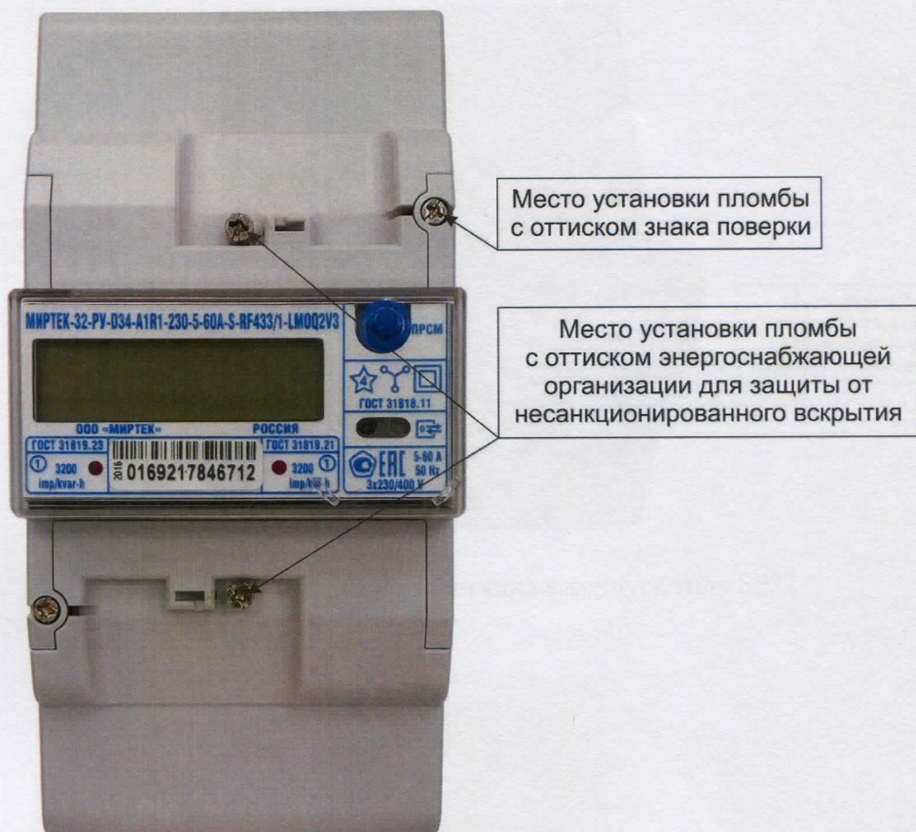
Рисунок 6 - Общий вид счетчика в корпусе типа D34