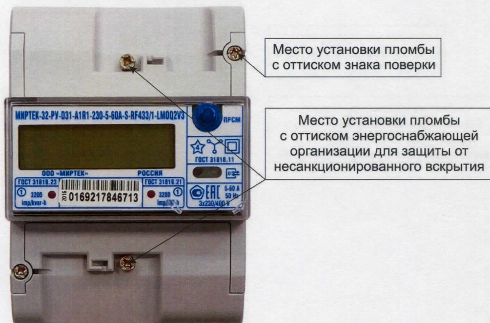
Рисунок 4 - Общий вид счетчика в корпусе типа D31