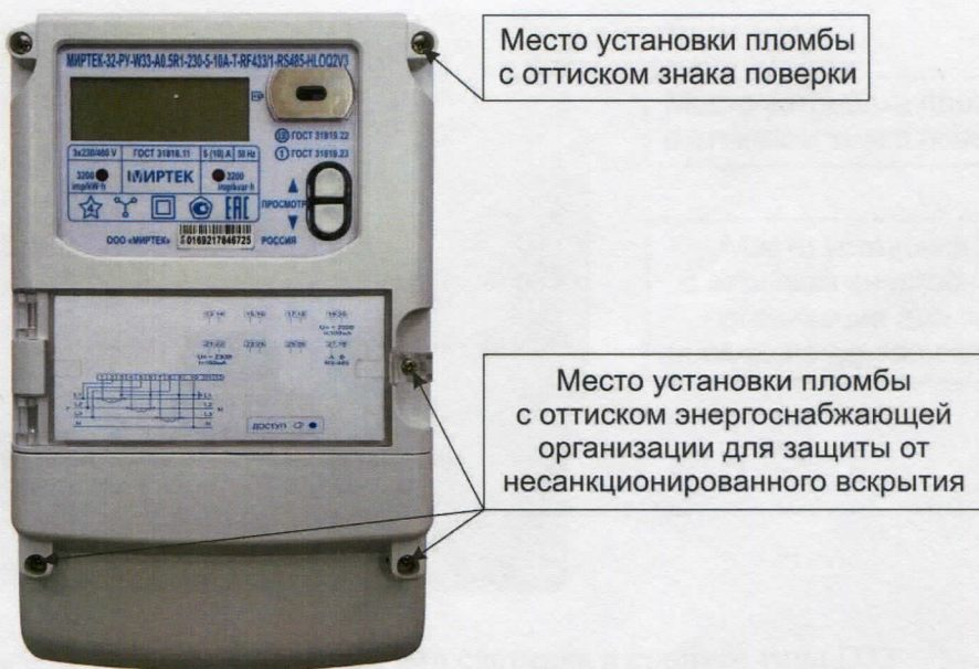
Рисунок 3 - Общий вид счетчика в корпусе типа W33